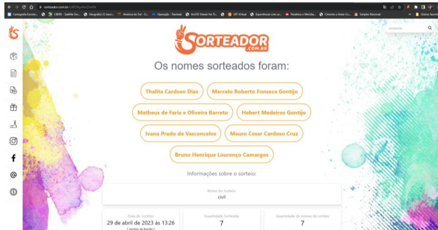
Figura 2 – Ordem das chapas para a votação.